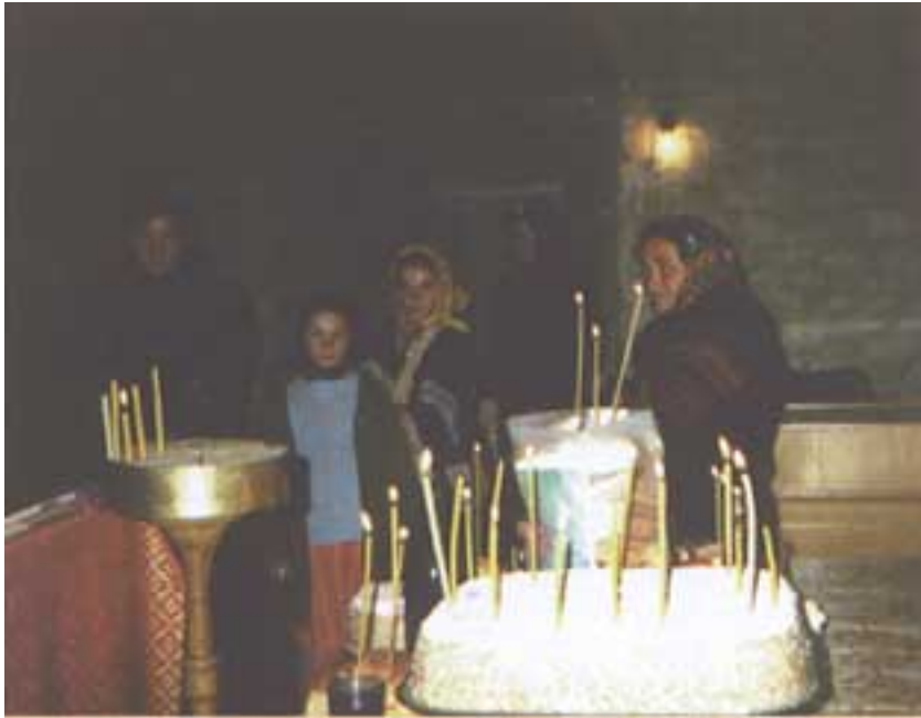
ill. 4 La coliva du mort